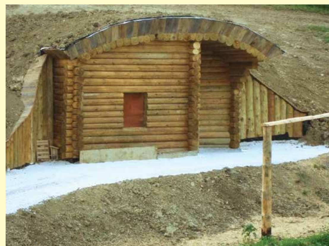
Zemljanka za shranjevanje pridelkov in predelkov iz učnega poligona Dole.

Zemlja je shranjevalec energije, poleti ohranja hlad, pozimi pa zadržuje toploto. To lastnost zemlje lahko izkoristimo za shranjevanje pridelkov. Pridelki potrebujejo v topli polovici leta hlad, da zadržijo vlago in pozimi višje temperature proti zmrzali. Ker nam zemlja daje možnost koriščenja te energije zlasti na kmetijskih območjih, smo v predlaganem projektu zasnovali izdelavo podzemne shrambe ali zemljanke kot pilotnega (učnega) objekta za izobraževanje o trajnostni rabi energije.