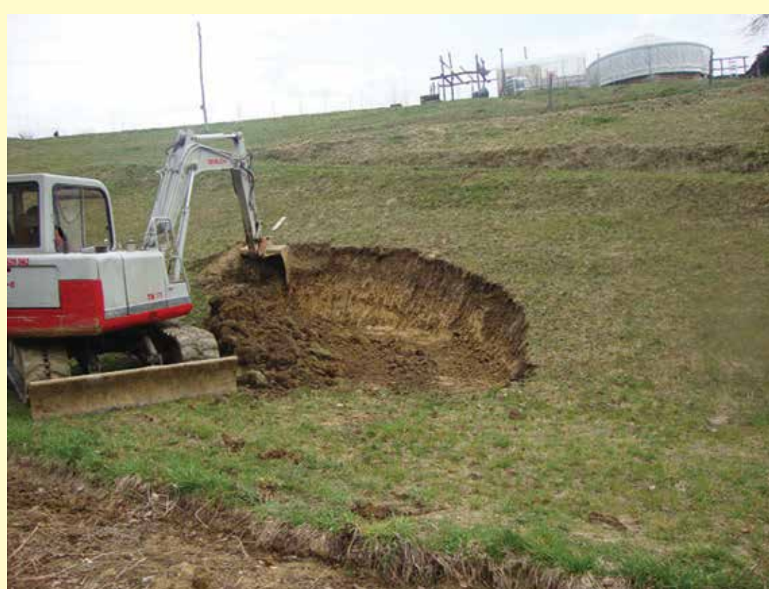
Izkop mesta za zemljanko je na ekspozicijsko ugodni legi.