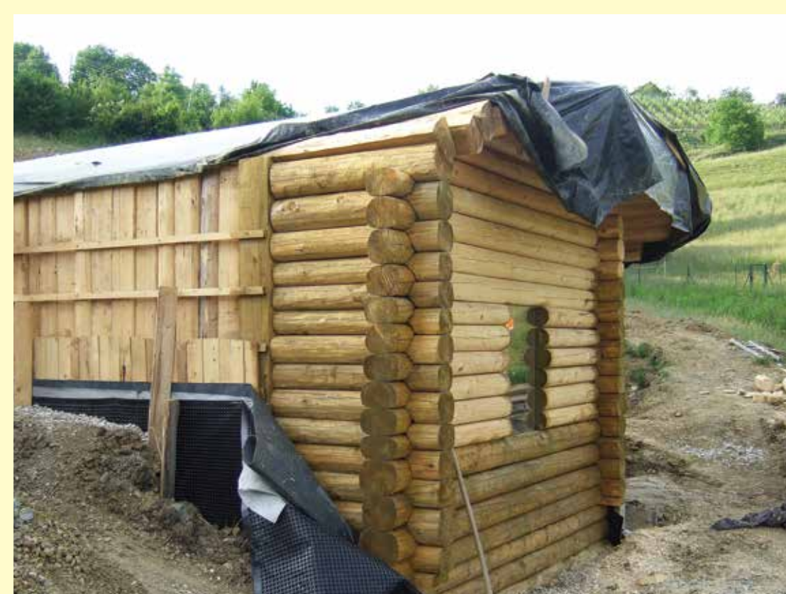
Stene zemljanke so iz lesa jelke in smreke.