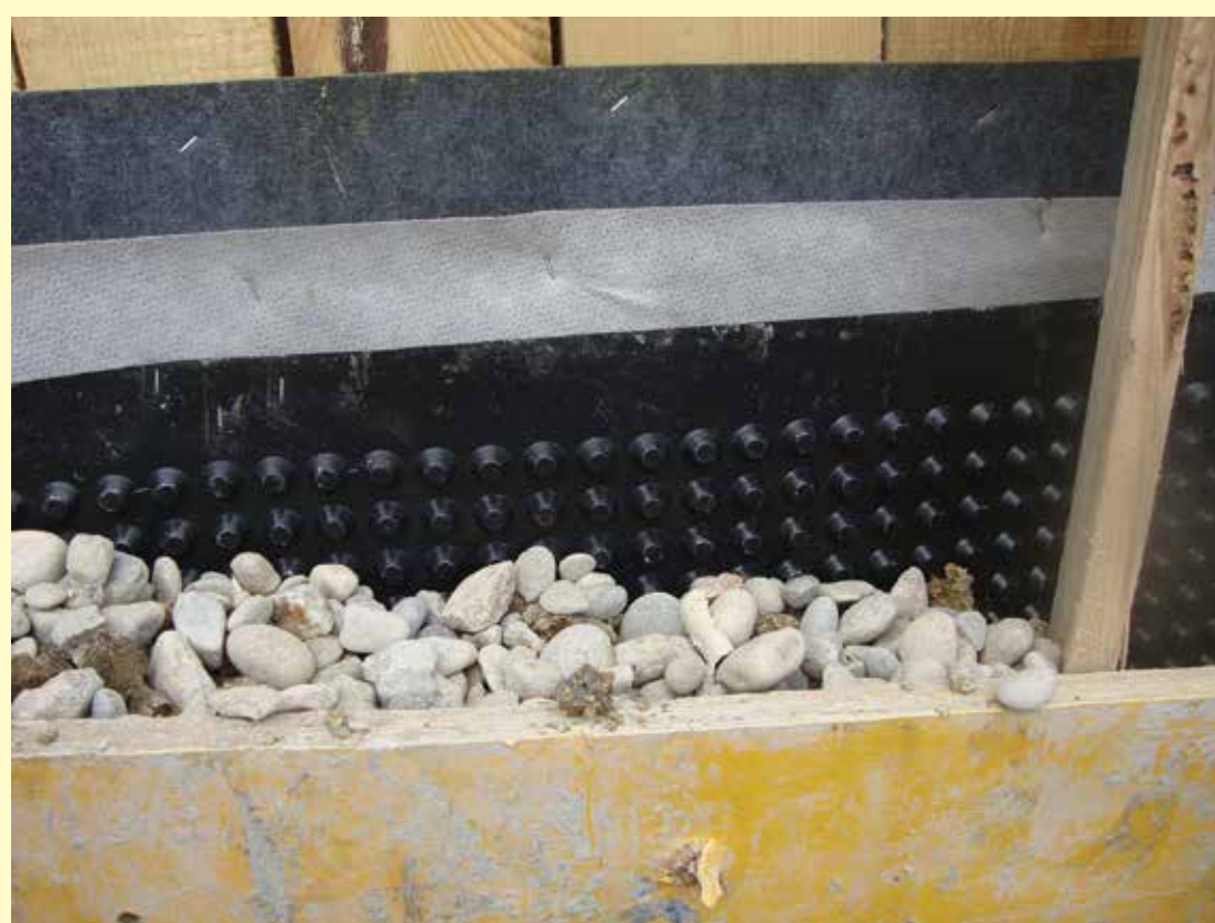
Prodniki so drenaža na zunanji strani stene zemljanke.