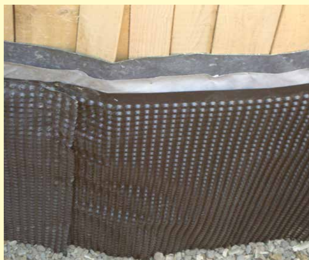
Pred vlago je les zavarovan z dvojno folijo in filcem, navzven pa s prodom.